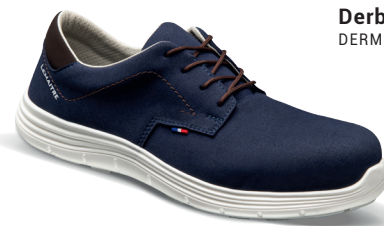
Derby marine S3 SRC DERMS30BM